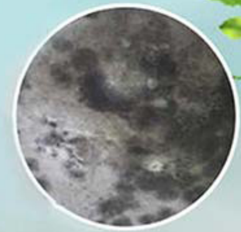
کیک و قارچی